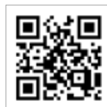
会館ホームページ

※上記以外の場所への駐車は、短時間であっても近隣の店舗等へのご迷惑となりますので、固くお断りさせていただきます。 ※②の駐車場は、原町保健センター及び周辺施設の利用状況により、ご利用いただけない場合がございます。