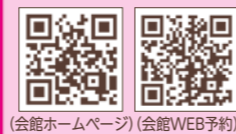
(会館ホームページ) (会館WEB予約)